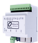
Moduł interkomowy IP