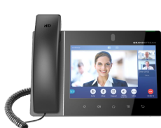
Telefon IP Wideotelefon IP