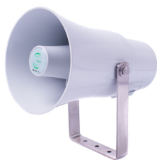
Głośnik tubowy IP