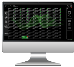
Konsola dyspozytorska aplikacja na PC