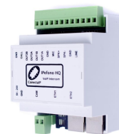
Moduł interkomowy IP