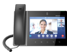
Telefon IP Wiedotelefon IP